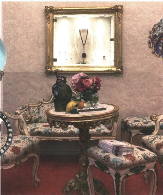
L'anello Riccio, impreziosito da diamanti, zaffiri e opali e il ciondolo Granchio in oro rosa, diamanti e corallo salmone