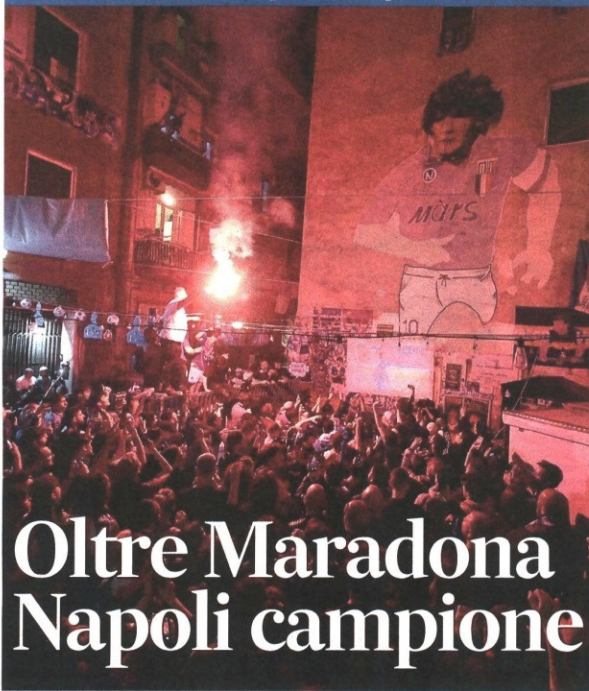
La festa dei tifosi del Napoli davanti al murale di Maradona

A Udine 1-1 e invasione di campo: trionfo dopo 33 anni. Città in festa