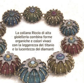
La collana Riccio di alta gioielleria combina forme organiche e colori vivaci con la leggerezza del titanio e la lucentezza dei diamanti

«Per realizzare un gioiello bisogna avvalersi del sapere prezioso di tante persone, perché ogni fase richiede un artigiano specializzato. Oggi il mercato si trova in un momento