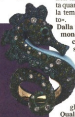
L'anello Chantecler Cavalluccio in titanio, oro, diamanti blu, verdi, bianchi e turchese

«DALLE SFUMATURE MERAVIGLIOSE DI QUESTE ACQUE LE COLLEZIONI ANEMONE, RICCIO E STELLA MARINA»