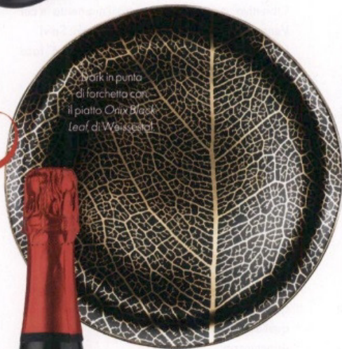
Spark in punta di forchetta con il piatto Onix Black Leaf di Waascoat

...o picche . Nel regno della dark queen dove la seduzione è la sua arma e l'emozione il suo gioco