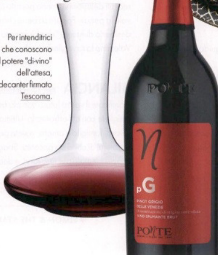
Per intenditrici che conoscono il potere "di-vino" dell'attesa, il decanter firmato Tescoma.