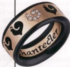
Legge di attrazione tra diamanti bianchi e smalto nero nella fede Carousèl di Chantecler.