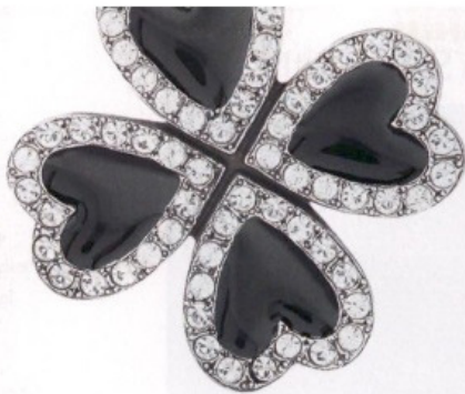
Trompe l'oeil l'orecchino con cuori dark, Saint Laurent by Anthony Vaccarello.

Non i soliti fiori please: un bouquet di frutta matura, spezie dolci, cacao e mandorle. E il mix di rum pregiati, invecchiati fino a 25 anni, di Zacapa XO. Sarà il vostro elisir.