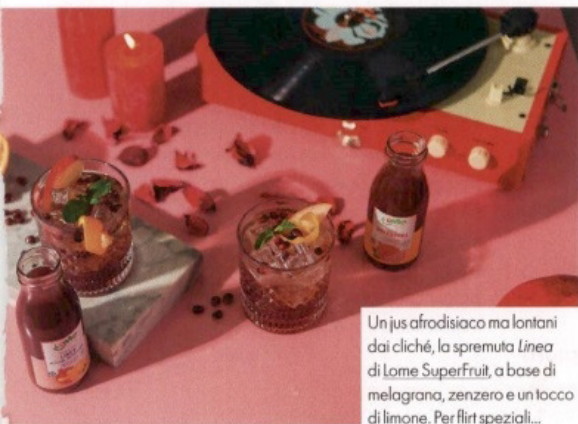
Un jus afrodisiaco ma lontani dai cliché, la spremuta Linea di Lome SuperFruit, a base di melagrana, zenzero e un tocco di limone. Per flirt speciali...

Una sorpresa pétillant vi aspetta con l'edizione speciale del Pinot Grigio Delle Venezie Doc di Ponte 1948: una rosa rossa in un bouquet di gelsomino.